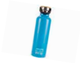
z.B. SEA TP SUMMIT 360° Trinkflasche