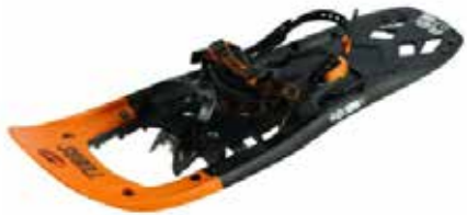
z.B. TUBBS Flex ALP