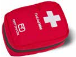
z.B. ORTOVOXX 1.Hilfe Set/Reiseapotheke