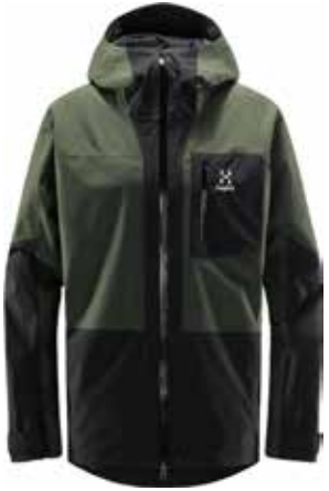
z.B. HAGLÖFS Lumi Jacket