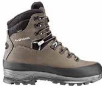
z.B. LOWA Tibet GTX