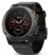
z.B. GARMIN Fenix 5