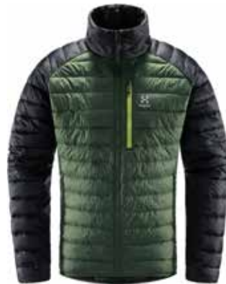
z.B. HAGLÖFS Spire Mimic Jacket