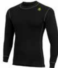
z.B. ACLIMA WarmWool Crew Neck