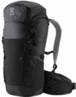
z.B. HAGLÖFS Spira 35