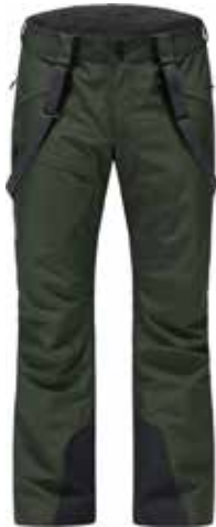
z.B. HAGLÖFS Lumi Pant